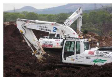
阿蘇の復旧現場で活躍する建機