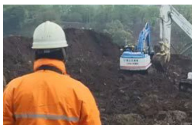
建機を遠隔で操作する様子

2016年4月に発生した熊本地震の国道57号線阿蘇立野地区大規模崩落現場においては、余震や更なる崩落の危険がある現場において、「無人化施工」が実施され、その多くがCATの建設機械が採用され活躍いたしました。